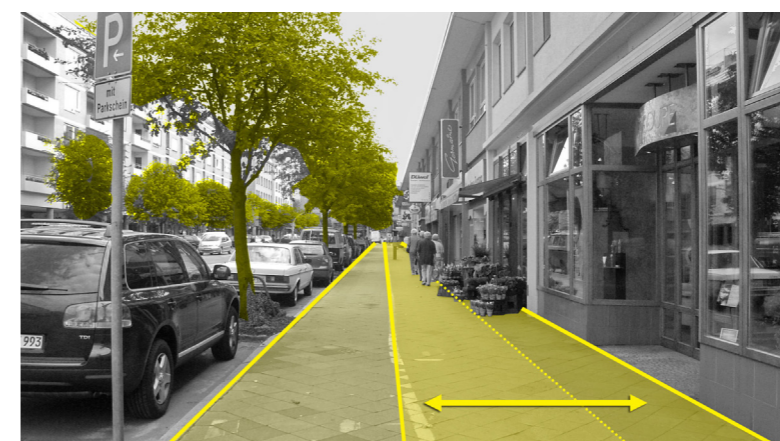
Steinweg, Analyse Rad- und Fußweggestaltung