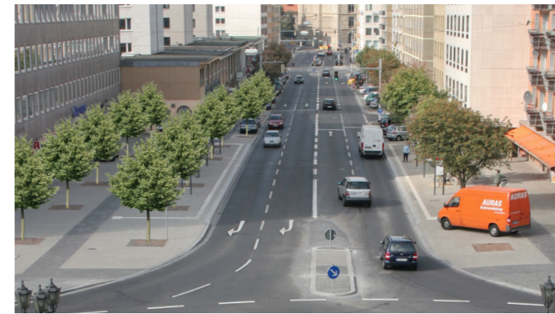
Steinweg, Blick vom Theater