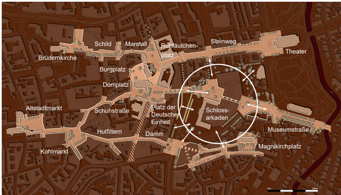
Stärkung und Qualifizierung der Ost-West-Verknüpfungsräume und Integration der Schlossarkaden