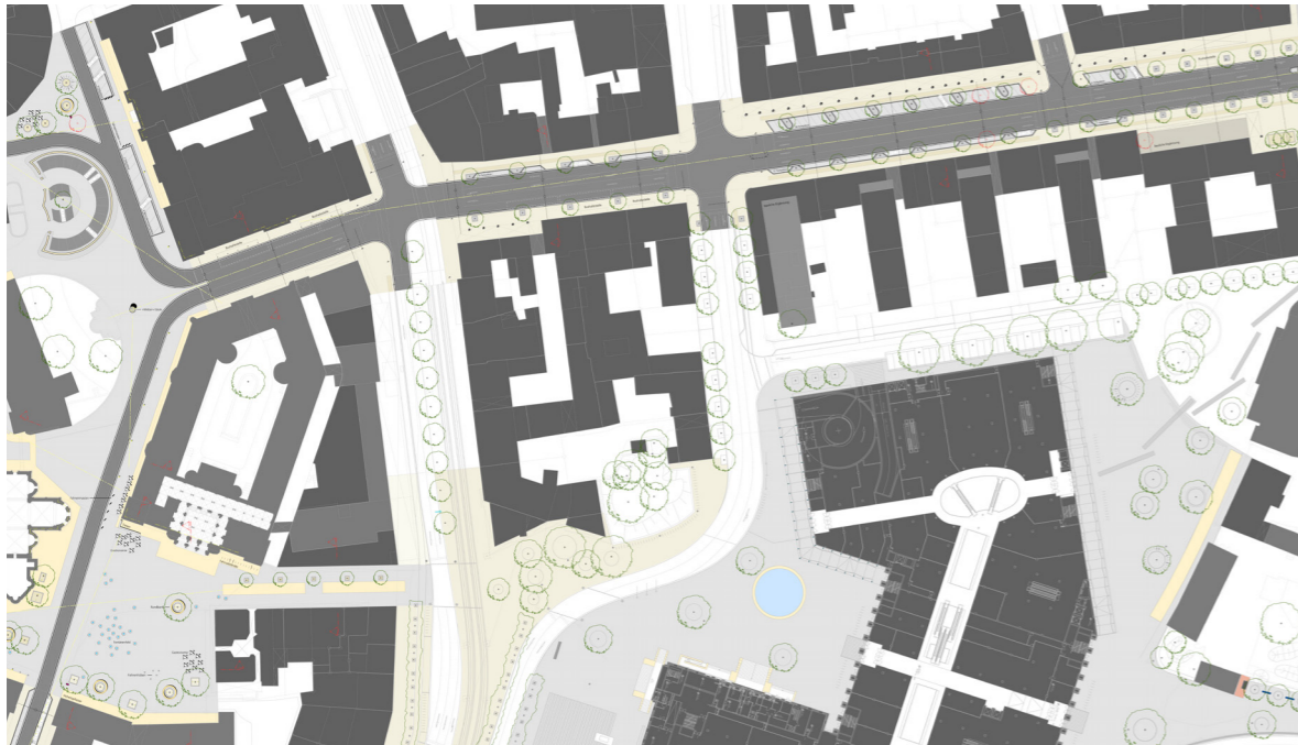
Umgestaltung Umfeld Schlossarkaden: Münzstraße, Platz der Deutschen Einheit, Langer Hof, Steinweg, Dankwardstraße

Braunschweig Oberzentrum | Niedersachsen Bevölkerung: 253.167 | Stand 2022