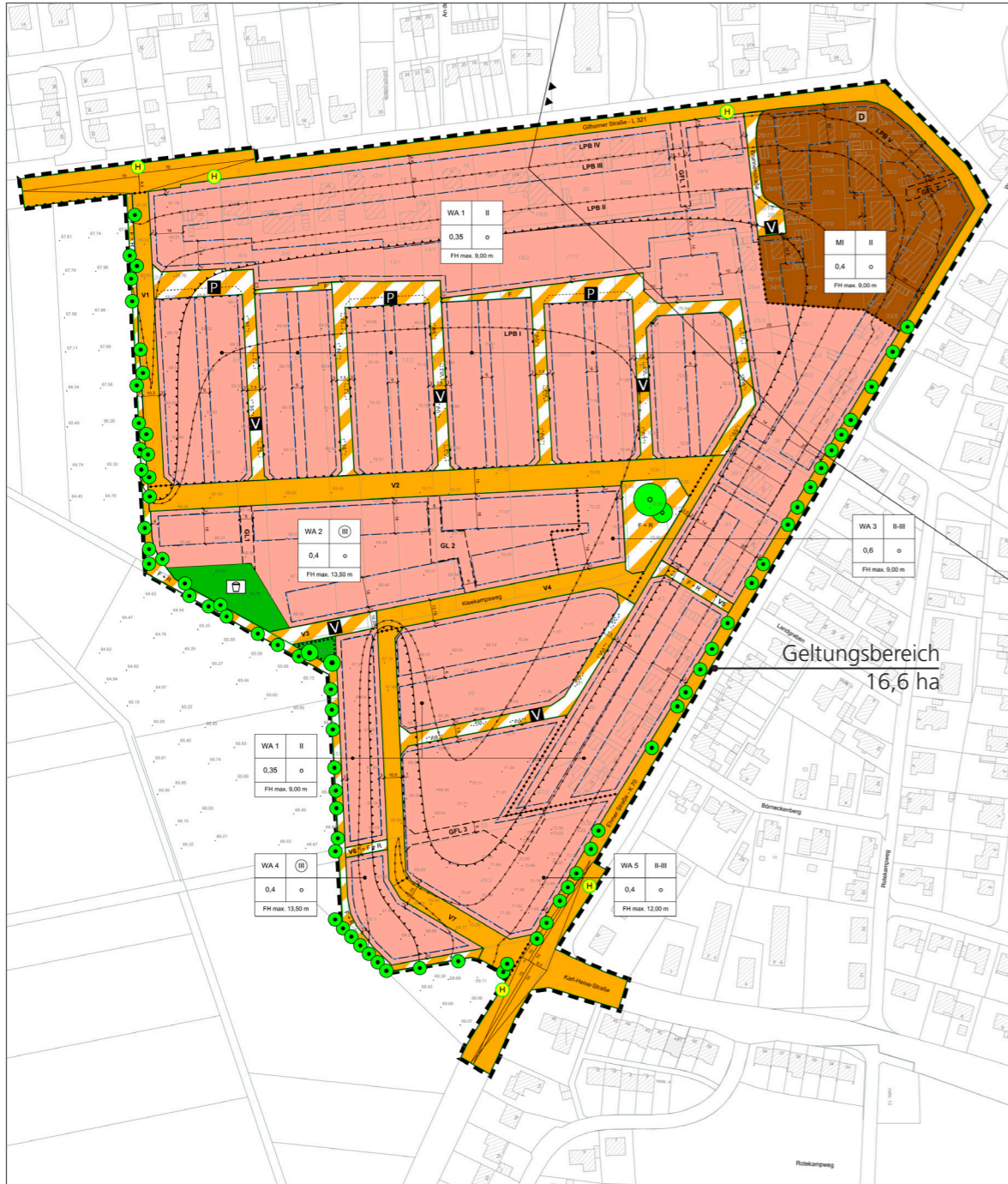
Planzeichnung zum Bebauungsplan

Wolfsburg Oberzentrum | Niedersachsen Bevölkerung: 127.168 | Stand 2023