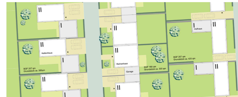
Bautypologien: Kettenhaus, Reihenhaus, Hofhaus