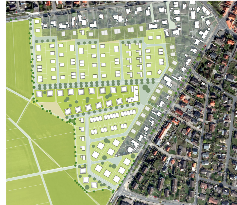
Vorzugsvariante Städtebauliches Konzept: Innere Achse